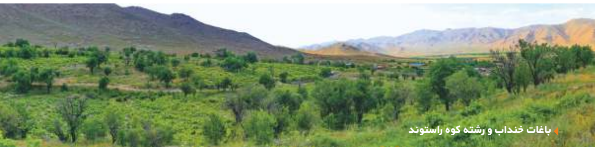
باغات خنداب و رشته کوه راستوند