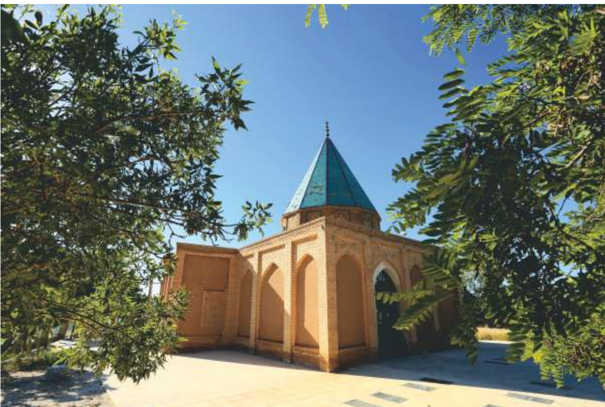
◀ امامزاده روستای آهنگران