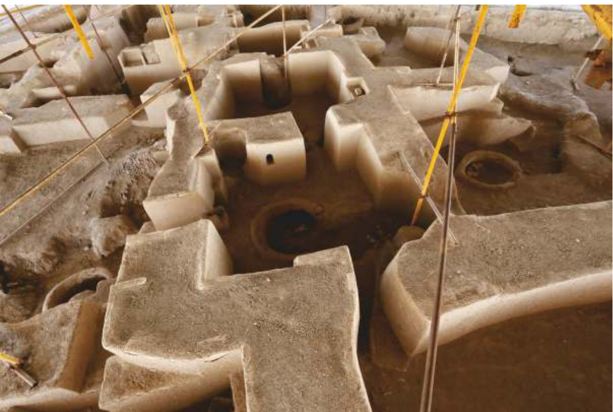
◀ شهر زیر زمینی ذلف آباد